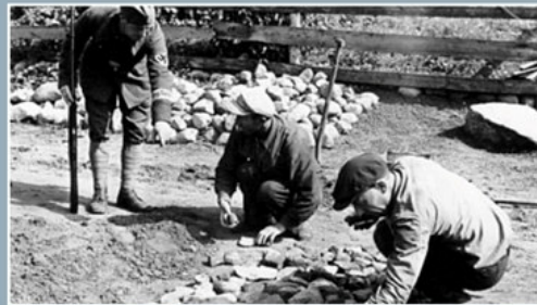
Zwangsarbeiter mit Aufseher, Sowjetunion 1941