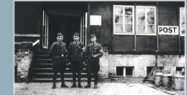
Aufgatter der Organisation Todt