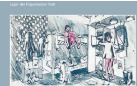
Lagerzeichnung eines Zwangsarbeiters