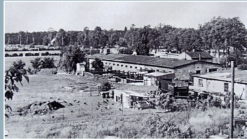
Lager der Organisation Todt, 1952

Weitere Informationen auf www.hauseichkamp.de/stolpersteine/#OT